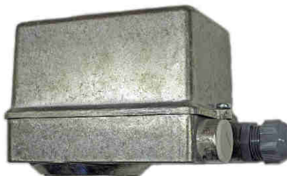
Kopplingsbox stor 0559-1003.00