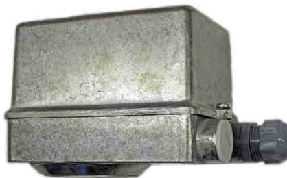
Kopplingsbox stor 0559-1003.00