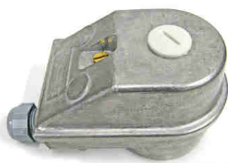
Kopplingsbox liten 0559-1002.00

Vi har ett stort sortiment av tillbehör för elpatroner såsom kopplingsboxar, termostater, temperaturbegränsare, genomströmningstuber.